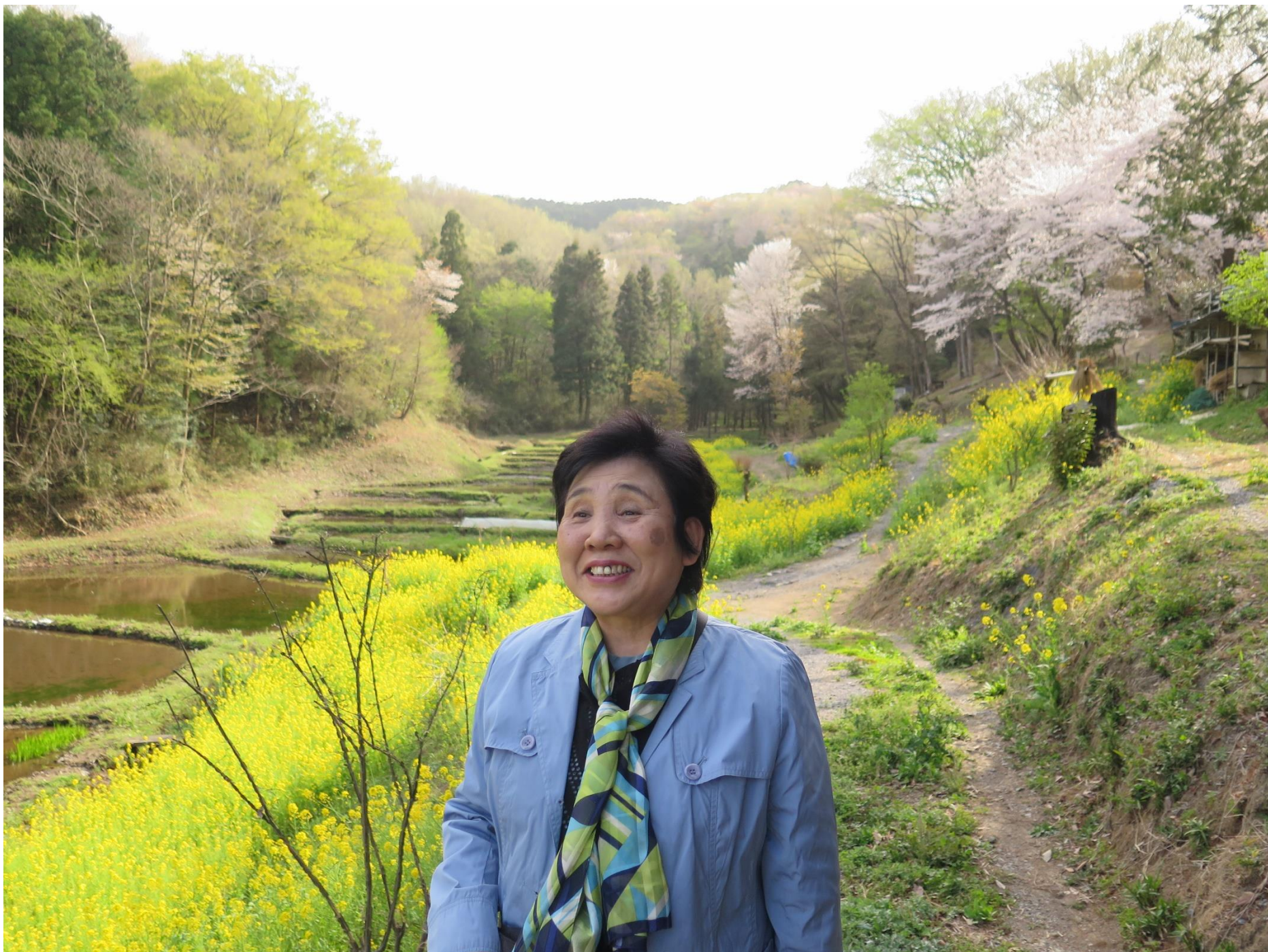
小川町遠ノ平の太陽光発電施設建設予定地 地元の農家が保存してきた棚田の周辺の森林がパネルにかわる