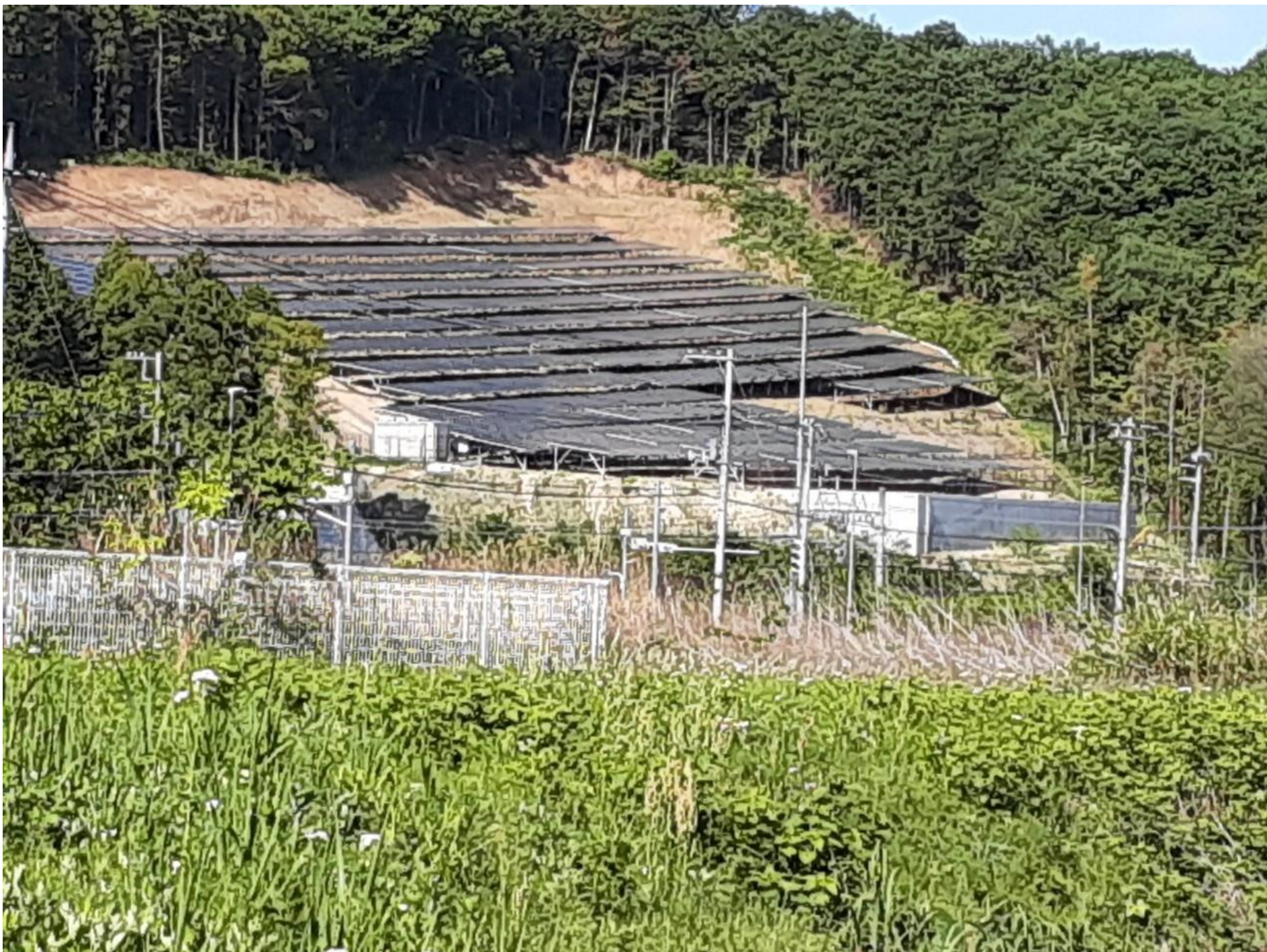
嵐山町志賀の太陽光発電施設 パネルのすぐ下を東部東上線が走る。志賀にもう一つある太陽光 発電施設が一昨年崩れ、東上線まで数10メートルに迫った