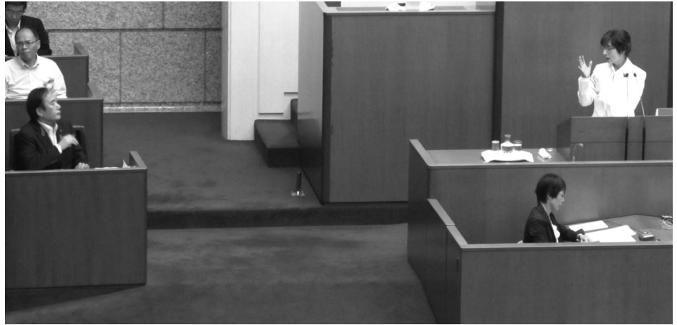
知事に向かって再質問

だから、知事がトップダウンで、思いつきで、あそこにタワーを誘致する、だけどタワーが失敗した。今度は三菱地所が来る、これも失敗した。だから今度は病院だと。これが全く理解できないということなんです。そのことについて、どう理解しているのかということについてお尋ねした