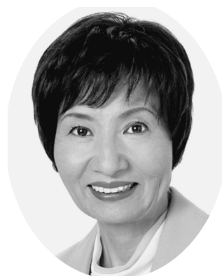
日本共産党埼玉県議会議員団