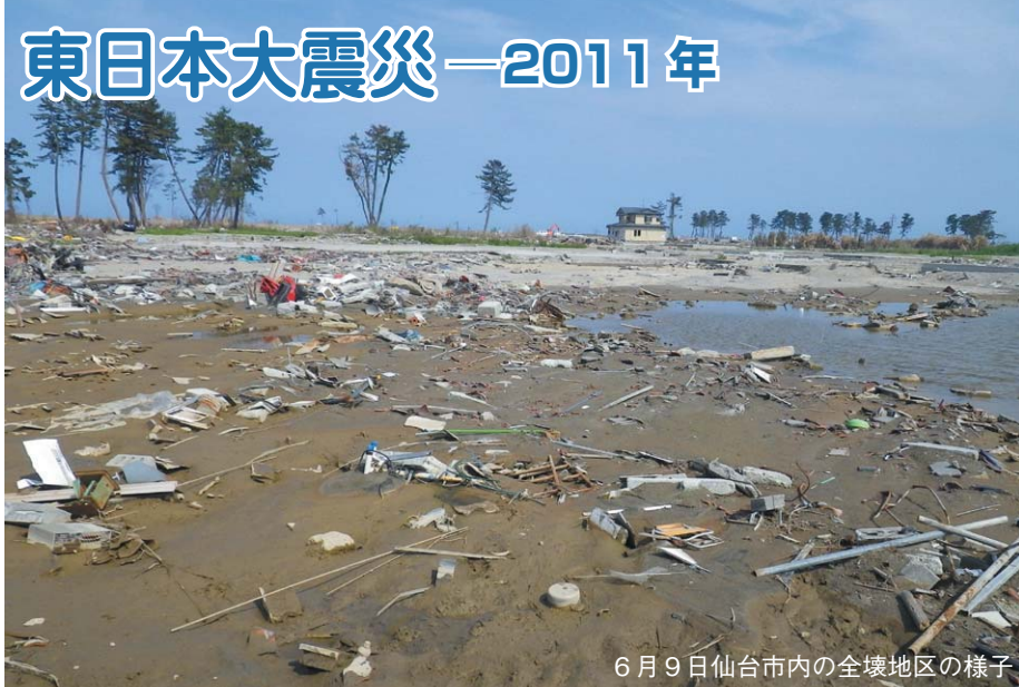
6月9日仙台市内の全壊地区の様子