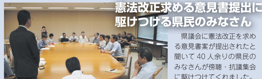
憲法改正求める意見書提出に 駆けつける県民のみなさん

県議会に憲法改正を求める意見書案が提出されたと聞いて40人余りの県民のみなさんが傍聴・抗議集会に駆けつけてくれました。