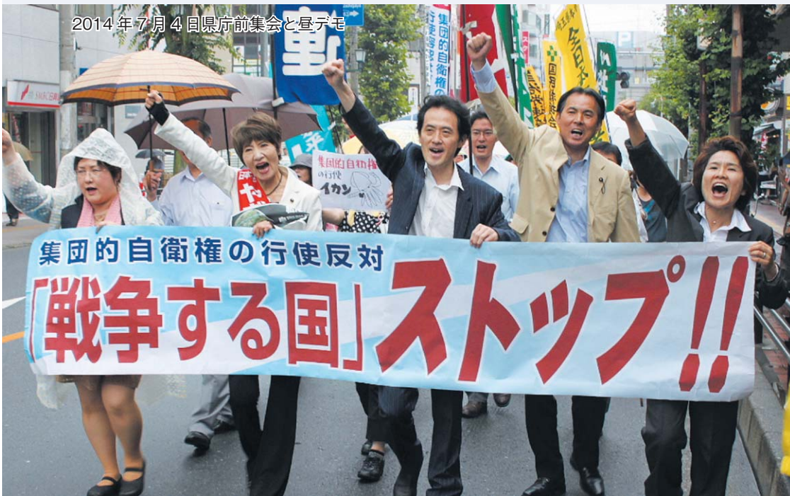
2014年7月4日県庁前集会と昼デモ

2 前項の目的を達するため、陸海空軍その他の戦力は、これを保持しない。国の交戦権は、これを認めない。