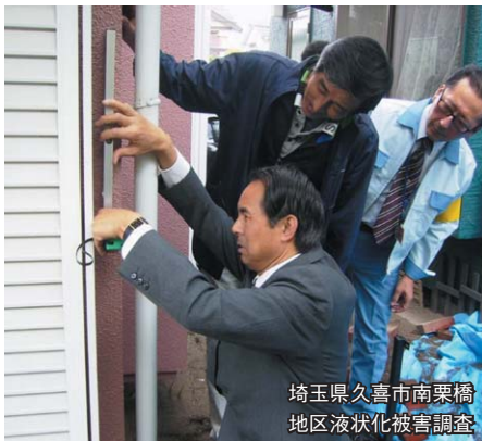
埼玉県久喜市南栗橋 地区液状化被害調査