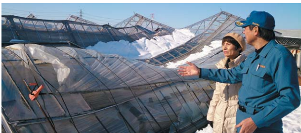
2月18日深谷市視察。右から村岡県議、柳下県議